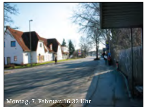
Montag, 7. Februar, 16:32 Uhr