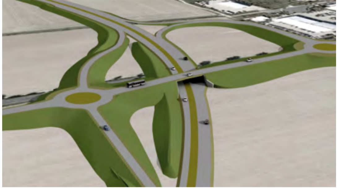
...CDU/SPD daraus machen wollen.