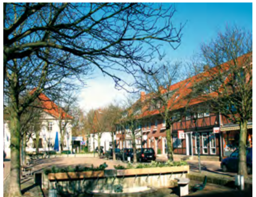
„Erträumter Mittelpunkt für Arnum?“

Wie konnte es nur zu dieser Übertreibung kommen? Die Antwort: weil man vor 10 Jahren – so alt ist die Planung nun schon – nur groß denken konnte, weil ständig ansteigender Verkehr vorausgesagt wurde. Der aber ist nicht eingetreten. Wo in 2015 im Norden ca. 40.000 Kfz vorhergesagt wurden, fahren bei der letzten Zählung nur noch 26.000 Kraftfahrzeuge, die dann auch noch auf alte und neue B3 aufgeteilt werden. Dafür aber ist keine vierspurige Trasse nötig. Die Alternative liegt auf der Hand. Es ist die kleine Ausbauvariante: zweispurig, ebenerdig und ohne Autobahnkreuz bei Devese.