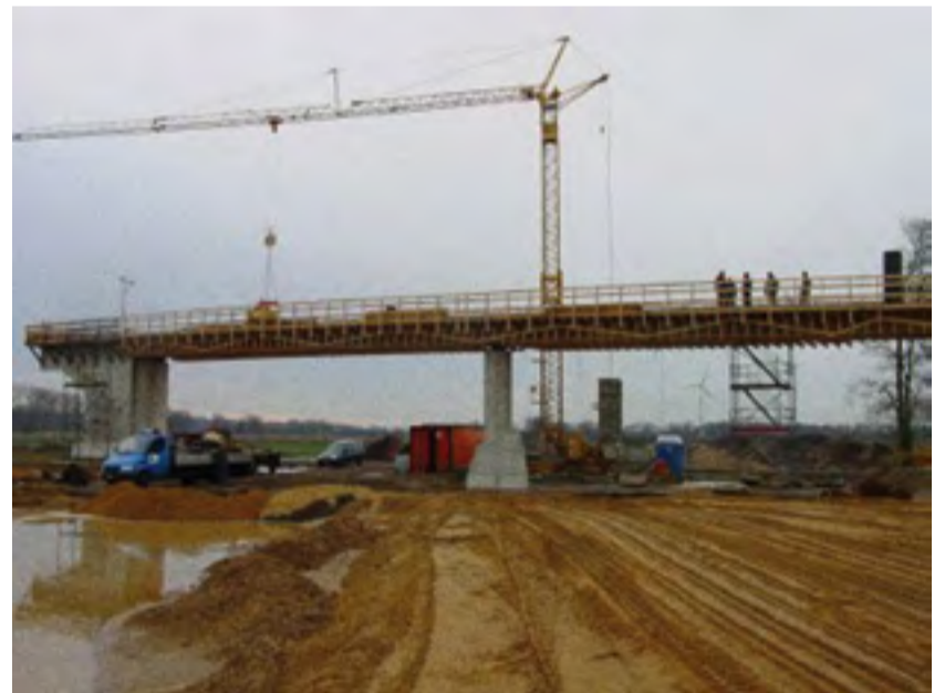
Real geplanter Mittelpunkt für Devese!