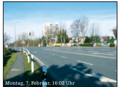
Montag, 7. Februar, 16:02 Uhr