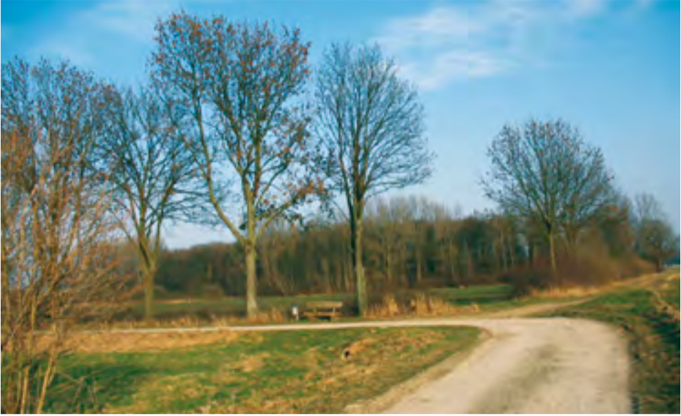
Naturidyll im Programm der SPD und was...