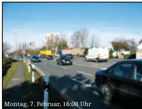
Montag, 7. Februar, 16:00 Uhr

werk maßlos übertrieben groß ausfällt. Der CDU-Umweltminister Röttgen ruft alle Kollegen auf: Politik mit den Augen unserer Kinder zu betreiben, also der folgenden Generation gegenüber verantwortlich zu handeln. Bei den Befürwortern der übergroßen B3-neu verhält dieser Ruf ungehört. Angesichts des rückläufigen Verkehrs würde uns die nächste Generation auffordern, die ewig gestrige Verkehrspolitik der Hemmingen CDU abzuwählen. Die CDU glaubt mit der B3-neu auf der richtigen Strasse zu sein. Nach der Wahl wird sie wohl feststellen müssen, dass es auch für sie ein Irrweg war.