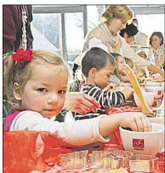
Die Kinder haben bei der Plätzchengestaltung freie Hand. Mommertz

16 Kitakinder aus Arnum besuchen die Bäckerei Steinecke