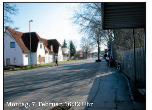
Montag, 7. Februar, 16:32 Uhr