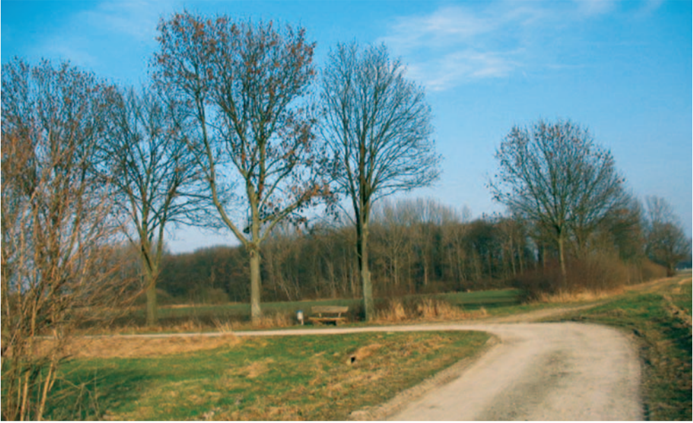
Naturidyll im Programm der SPD und was...