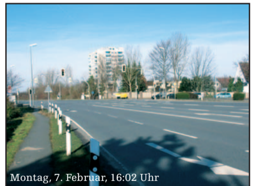
Montag, 7. Februar, 16:02 Uhr