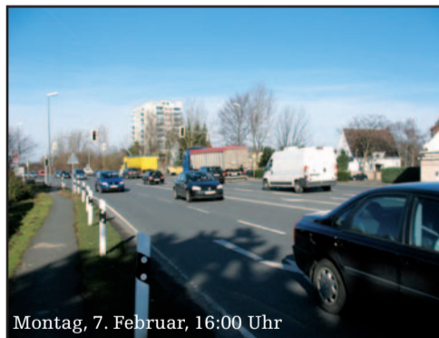
Montag, 7. Februar, 16:00 Uhr

werk maßlos übertrieben groß ausfällt. Der CDU-Umweltminister Röttgen ruft alle Kollegen auf: Politik mit den Augen unserer Kinder zu betreiben, also der folgenden Generation gegenüber verantwortlich zu handeln. Bei den Befürwortern der übergroßen B3-neu verhallt dieser Ruf ungehört. Angesichts des rückläufigen Verkehrs würde uns die nächste Generation auffordern, die ewig gestrige Verkehrspolitik der Hemmingen CDU abzuwählen. Die CDU glaubt mit der B3-neu auf der richtigen Strasse zu sein. Nach der Wahl wird sie wohl feststellen müssen, dass es auch für sie ein Irrweg war.