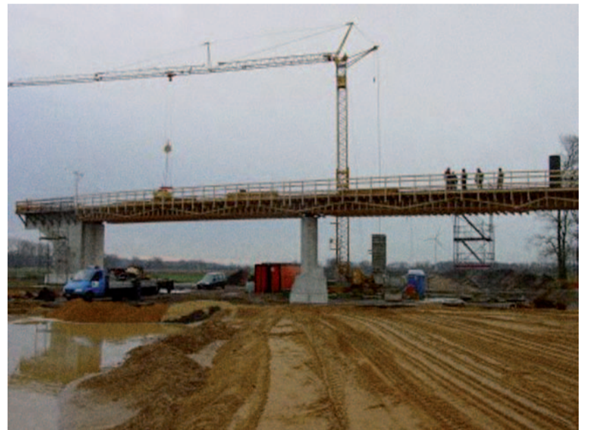
Real geplanter Mittelpunkt für Devese!