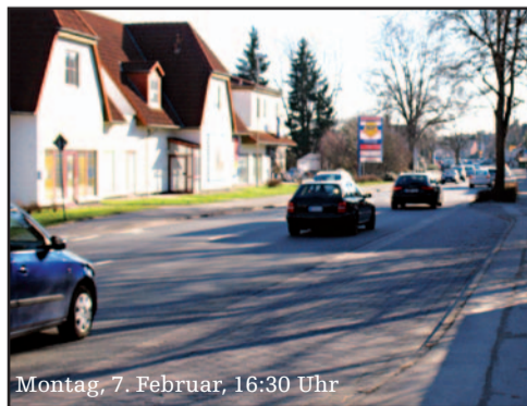
Montag, 7. Februar, 16:30 Uhr