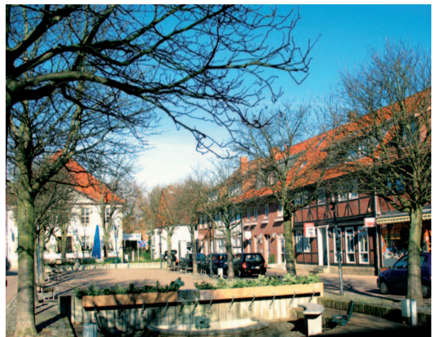
„Erträumter Mittelpunkt für Arnum?“

Wie konnte es nur zu dieser Übertreibung kommen? Die Antwort: weil man vor 10 Jahren – so alt ist die Planung nun schon – nur groß denken konnte, weil ständig ansteigender Verkehr vorausgesagt wurde. Der aber ist nicht eingetreten. Wo in 2015 im Norden ca. 40.000 Kfz vorhergesagt wurden, fahren bei der letzten Zählung nur noch 26.000 Kraftfahrzeuge, die dann auch noch auf alte und neue B3 aufgeteilt werden. Dafür aber ist keine vierspurige Trasse nötig. Die Alternative liegt auf der Hand. Es ist die kleine Ausbauvariante: zweispurig, ebenerdig und ohne Autobahnkreuz bei Devese.