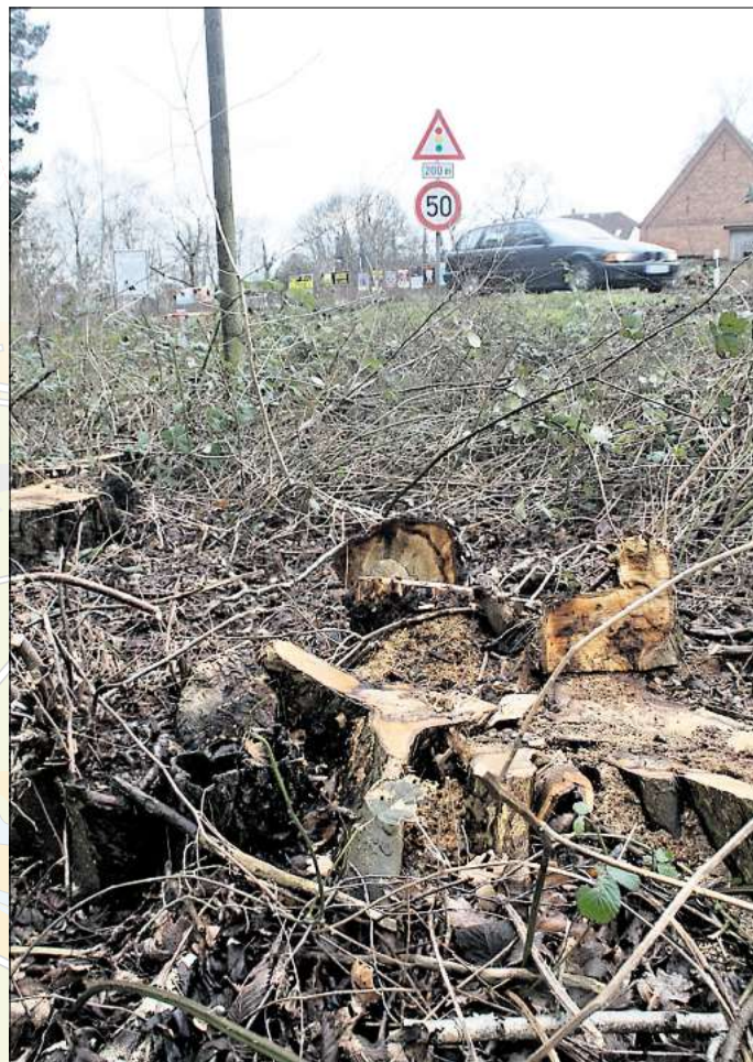
Die roten Zahlen in der Grafik sind im Text näher erläutert. Das Foto zeigt die B 3 nahe der Stadtgrenze von Hemmingen und Hannover. Dort sind für den Bau der Ortsumgehung Bäume gefällt worden. Zimmer